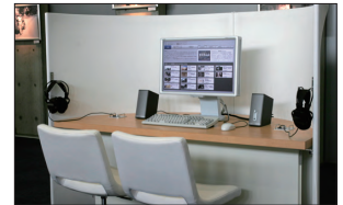
映像ステーションでの公開