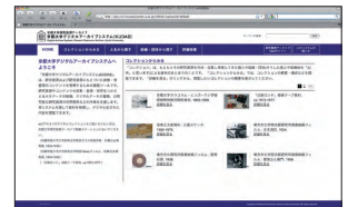
京都大学デジタルアーカイブシステムへの収録