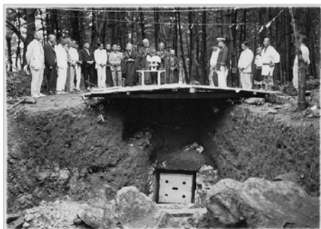
標題: [紙焼き写真]再埋棺後の慰霊式 資料番号: 日本53-3