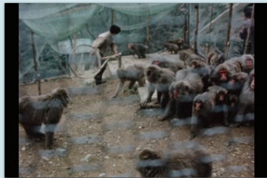
「京都嵐山ニホンザルA群全頭捕獲調査映像資料, 1971-1973」より 標題 : [映画] (3) 1972.2.12 ~ 2.16 資料番号 : CAAS MOV 2020/1 / 3